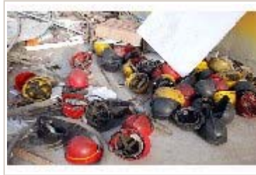
河南巨源煤矿瓦斯爆炸致26人死亡