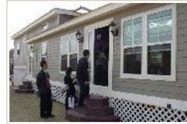
“移动房屋”出租打城管擦边球 高价令人咂舌