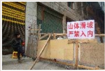
贵州遵义山体滑坡致11层居民楼垮塌 近千人疏散