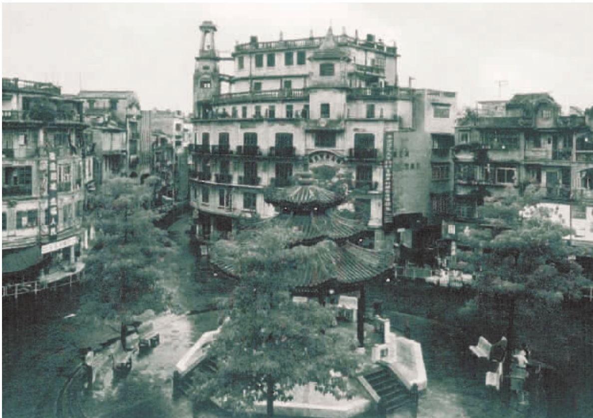
■以小公園中山紀念亭為中心的汕頭老街。

這是一座從來就不曾有城牆、城門和護城河的城市。這是一座帶有鮮明海外融合風格的城市。這是一座濃縮潮人出洋、華僑建設故鄉的傳奇史的城市。而汕頭老街，作為這座「百載商埠」不可替代的地標性建築群，至今仍強地保持著活力。