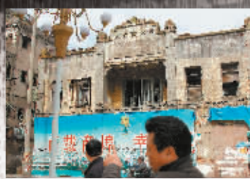
汕頭老街一棟老建築上掛著「百載商埠」的牌子，但破損的建築透著一份衰敗的蒼涼。

本版由星島日報海外版合編 本版撰文攝影：林旭燾 統籌：金強 支持採寫：方夢瑩 電郵：overseas@singtaonews.com