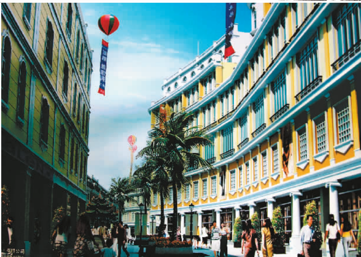
汕頭是中國34個開埠城市中開埠區原貌碩果僅存之地。

它們身上寫滿經濟開放和文化交融的輝煌；它們捱過汕頭淪陷、政權更迭的滄桑；它們曾歸於平凡，庇護多少平民免遭風雨；它們在各地舊城改造的轟隆聲中，終於倖免於難……百載白駒過隙，汕頭舊城日漸滄桑的容貌，能否再次打贏和時間的戰爭？