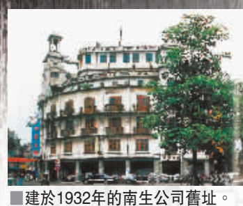
■建於1932年的南生公司舊址。